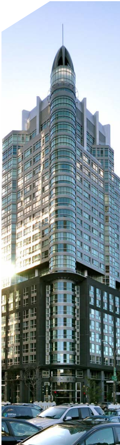
Hôtel Le Crystal

Multiver possède des manufactures à Québec et Montréal permettant donc de desservir des projets sur un vaste territoire, et ce, en se conformant aux distances exigées pour ce crédit. De plus, Multiver offre plusieurs produits dont les lieux de production ainsi que les lieux d'extraction des matériaux les composant se trouvent dans le rayon permis. Pour plus d'informations sur les produits éligibles, veuillez contacter un de nos représentants.