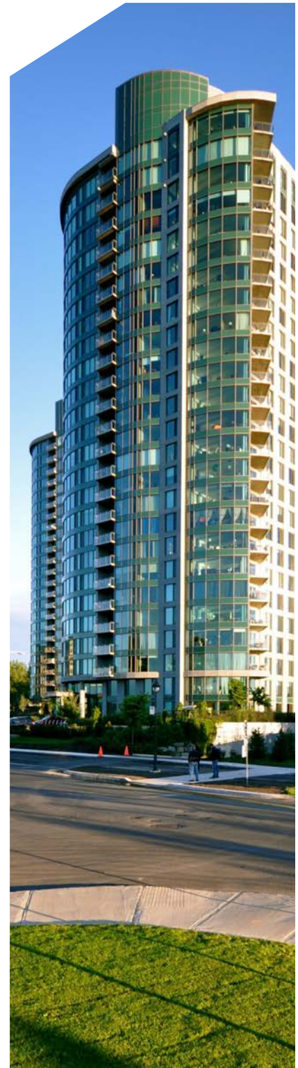
Condominium Le Vistal 1

Multiver offre un important éventail de verres énergétiques pouvant aider de façon significative à la réduction de la consommation énergétique d'un bâtiment. Les vitrages de Multiver, en plus de vous permettre d'atteindre les exigences LEED®, sont offerts dans différentes teintes afin de s'agencer au design voulu. Contactez un représentant chez Multiver qui vous aidera à déterminer le vitrage qui convient le mieux à votre projet.