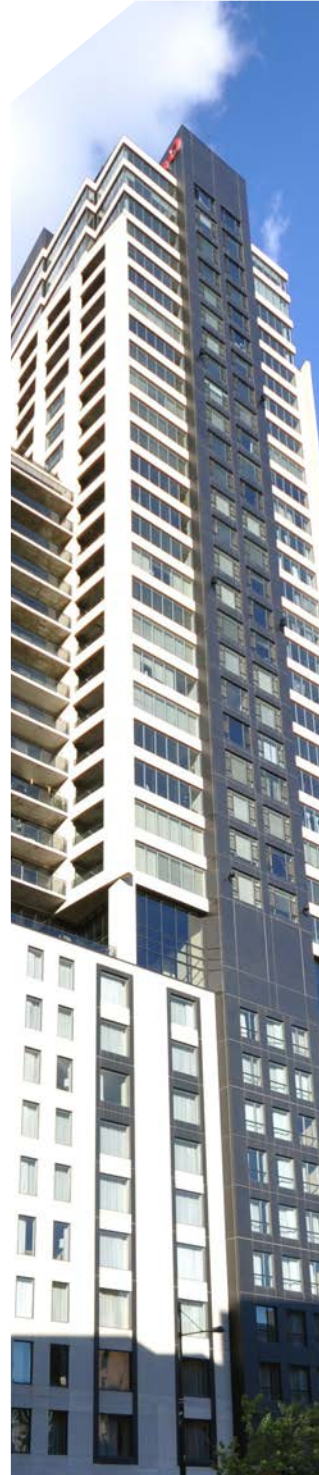
Hilton Garden Inn

Multiver a un vaste choix de verres possédant différents niveaux de transmission du visible qui offrent un apport de lumière naturelle dans les espaces intérieurs. Ces produits permettent de répondre aux exigences de ces crédits, et ce, sans compromettre les performances énergétiques. Nos verres disponibles procurent donc une grande flexibilité de design pour tous types de projets. Pour plus d'informations et de l'aide pour choisir le bon verre qui s'applique à votre projet, contactez un de nos représentants.